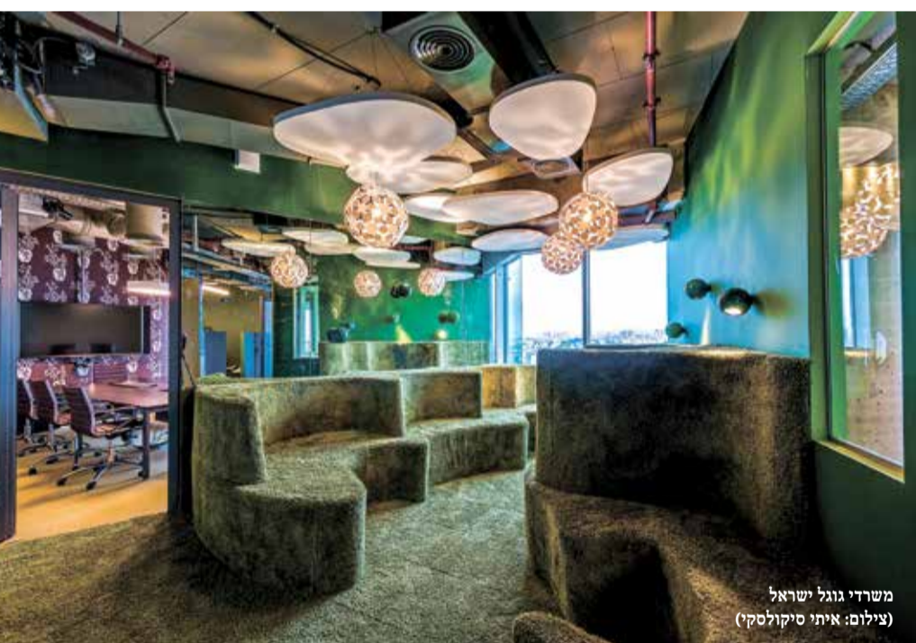
משרדי גוגל ישראל

בעזרת מחיצות חלקיות, שנותנות מענה לפרטיות מצד אחד ומצד שני מאפשרות העברה של אור ותחושה של חלל פתוח בין העובדים". עיצוב החלל משלב בין אווירה תעשייתית לבין אווירה ביתית. מצד אחד משתמשים באופן נרחב בעץ המשרד חמימות, ומצד שני מערכות התאורה והמיוזוג בתקרה ותורו חשופות כדי לשמר מראה תעשייתי. הצבעים השולטים הם לבן וחום-עץ עם נגיעות של ירוק, המתכתבות בעדינות עם לוגו החברה. "העיצוב שומר על כבוד המותג, ולא מבליט אותו בצורה בוטה מדי, כדי לשמור על אותנטיות העיצוב לתחושת הביתיות. אף אחד לא רוצה שיהיו פרסומות על קירות הבית שלו, וכך עשינו גם במשרדי החברה". בנוסף, מספר גולדברג, העיצוב חף מטרגדים עיצוביים במטרה להימנע מהצורך לחדש את העיצוב אחרי תקופת זמן קצרה. במסגרת שיתוף הפעולה עם חברת גלובל, תכננה החברה עבור הפרויקט את עמדת העבודה של העובדים. "מדובר בעמדת עבודה ייחודית וייעודית,