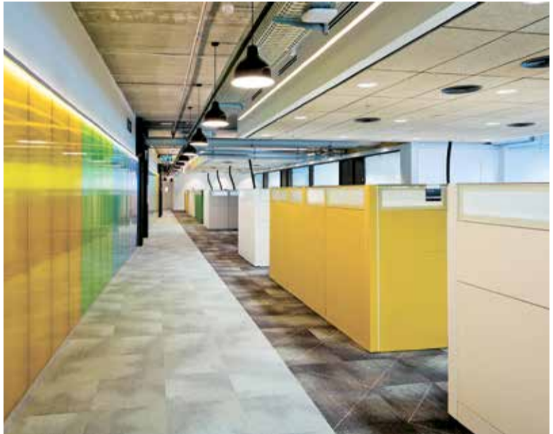
חלל עבודה פתוח במשרדי Mellanox

במרבית המשרדים בישראל, ובמשרדים רבים באירופה ובאפריקה, תמצאו עמדות עבודה וכסאות המיוצרים, מזה 30 שנה, ע"י חברת גלובל הבינלאומית. חברה זו היא בעלת המותגים Magenli-Teknion, Tzora, והצליחה להפוך לספקית הריהוט של כמה מהחברות הגדולות בעולם, תוך שהיא מתמודדת בהצלחה עם חברות ענק בינלאומיות. שלושה אדריכלים מספרים על המשרדים, שעיצבו ועל האופן שבו תרמה גלובל לתכנונם המוצלח / שחר בן-פורת