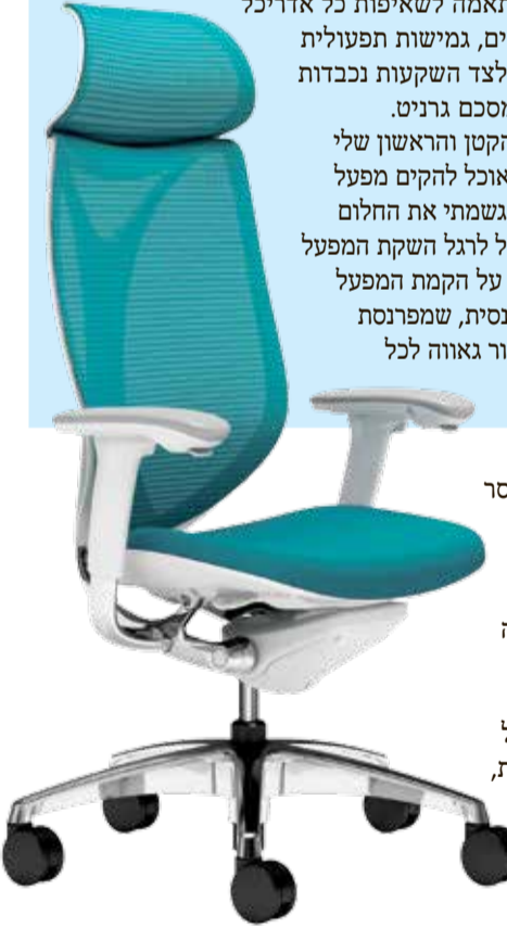
ממוצרי חברת גלובל